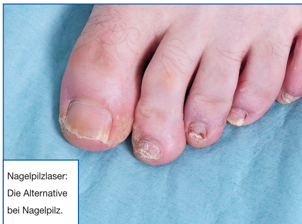
Nagelpilzlasers: Die Alternative bei Nagelpilz.

Eine medikamentöse Behandlung mit ihren Nebenwirkungen oder der Gefahr, Unverträglichkeiten auszulösen, führt nicht immer zur gewünschten Verbesserung. Als ungeliebte Alternative muss man den Nagel durch einen operativen Eingriff entfernen. Immer populärer wird die Lasertherapie als sichere und zuverlässige Behandlungsmethode.